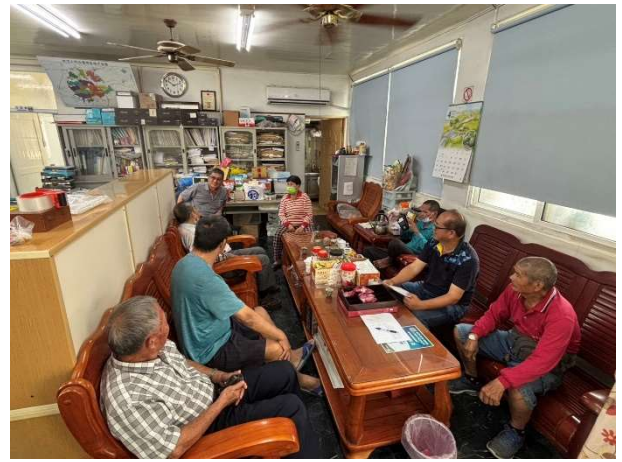
說明：在地民眾與會情形