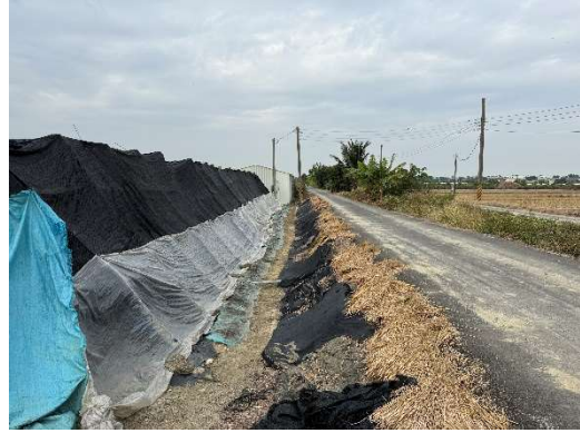
日期：115 年 1 月 9 日 位置：五汴頭二輪小排二之二