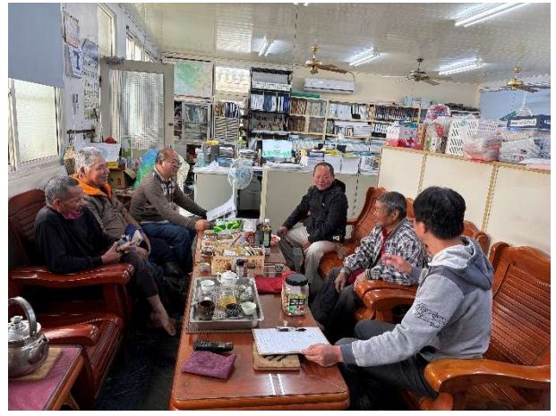
說明：在地民眾與會情形