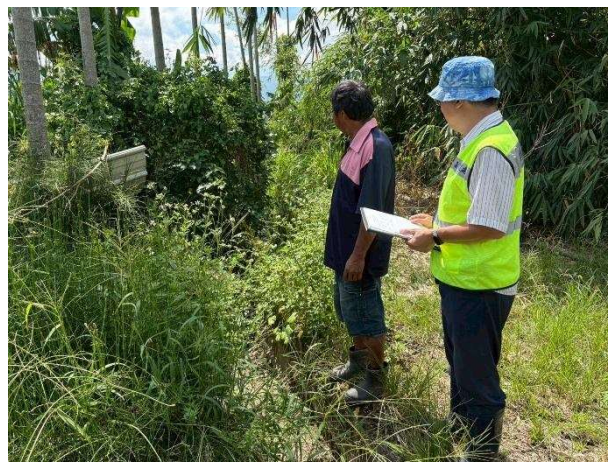
說明：獺祠圳小給一現勘