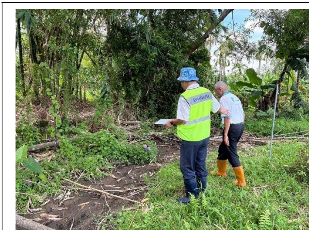
說明：頂埔圳小給一之四現勘