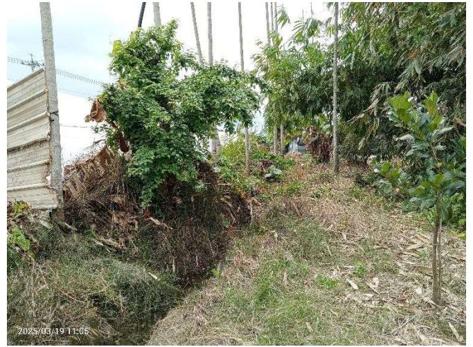
時間：114 年 3 月 19 日 說明：獺祠圳小給一現地