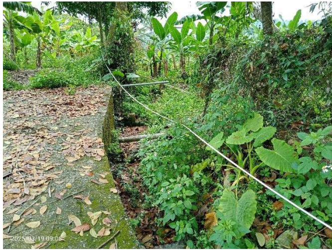
時間：114 年 3 月 19 日 說明：頂埔圳小給一之四現地