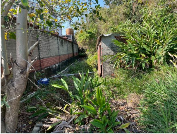
時間：114年6月11日 說明：牛庄小給三之八