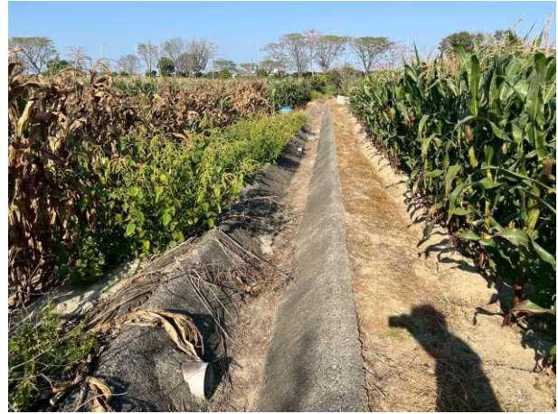
時間：114年6月11日 說明：蘇厝小給三之八