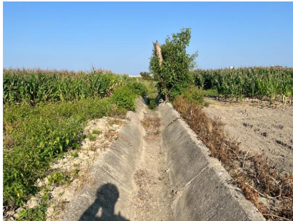
時間：114年6月11日 說明：港子尾小給一之五